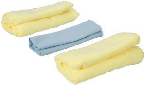
Desengrasado con paño