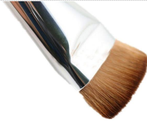
Desengrasado con cepillo