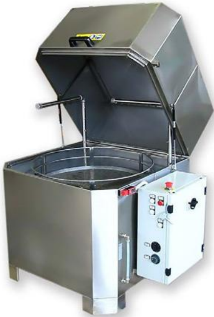
Cesta giratoria u oscilante